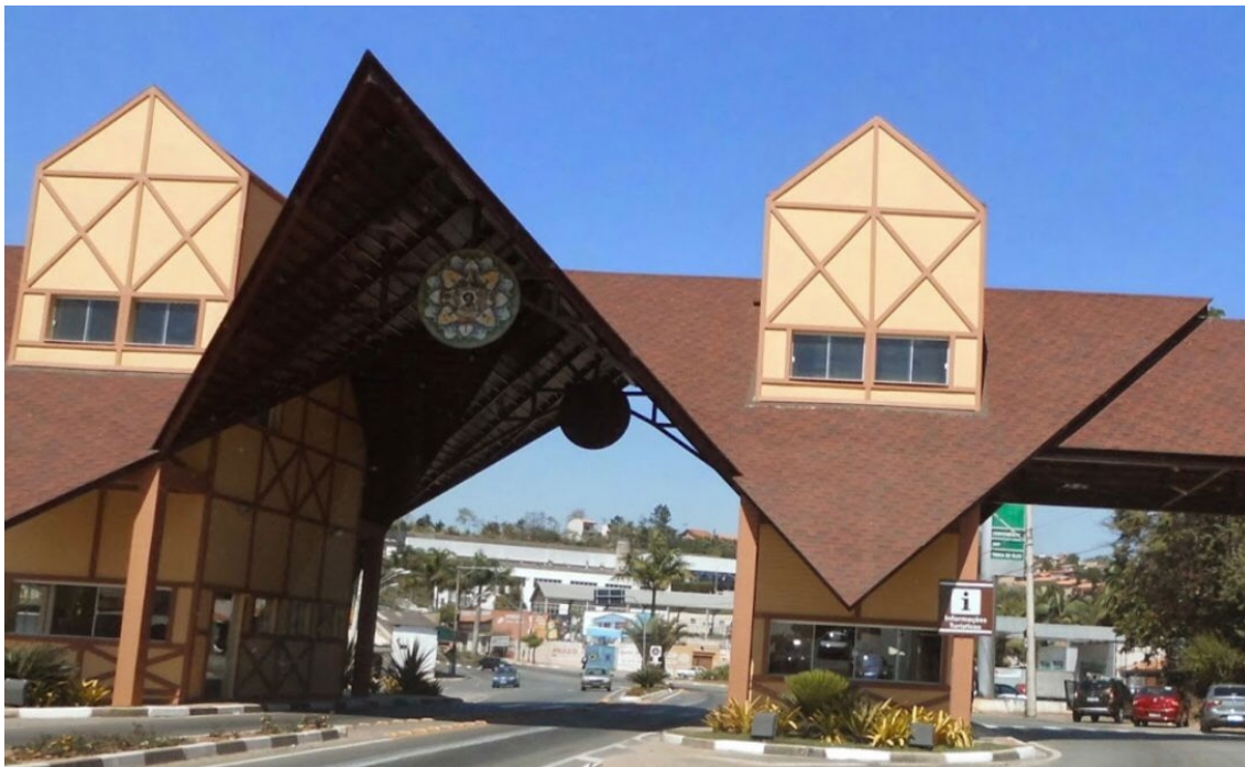
Figura 1 – Fotografia do portal anterior à reforma, em que se visualiza obra da então exposta

indagações de alguns cidadãos que externaram a preocupação de parte da população, zelosa da história local.