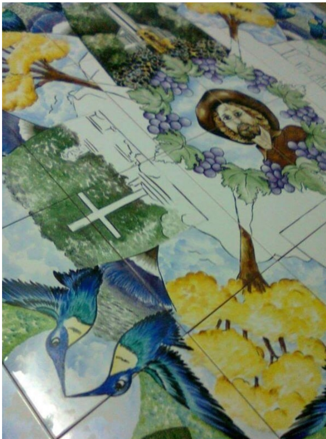
Figura 3 - Detalhe de obra da artista Cecilia Arruda

Rua São Paulo, 355 - Jd. Renê - CEP 18135-125 - Caixa Postal 80 - CEP 18130-970 CNPJ/MF: 50.804.079/0001-81 - Fone: (11) 4784-8444 - Fax: (11) 4784-8447 Site: www.camarasaoroque.sp.gov.br | E-mail: camarasaoroque@camarasaoroque.sp.gov.br São Roque - 'A Terra do Vinho e Bonita por Natureza'