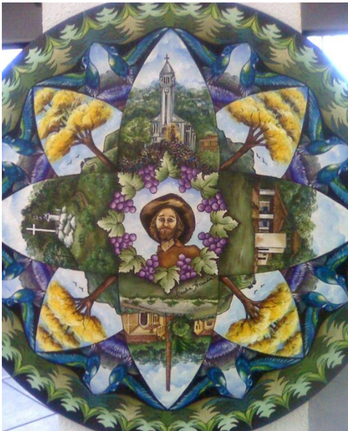
Figura 4 - Visão frontal da obra da artista plástica Cecília Arruda

Rua São Paulo, 355 - Jd. Renê - CEP 18135-125 - Caixa Postal 80 - CEP 18130-970 CNPJ/MF: 50.804.079/0001-81 - Fone: (11) 4784-8444 - Fax: (11) 4784-8447 Site: www.camarasaoroque.sp.gov.br | E-mail: camarasaoroque@camarasaoroque.sp.gov.br São Roque - 'A Terra do Vinho e Bonita por Natureza'