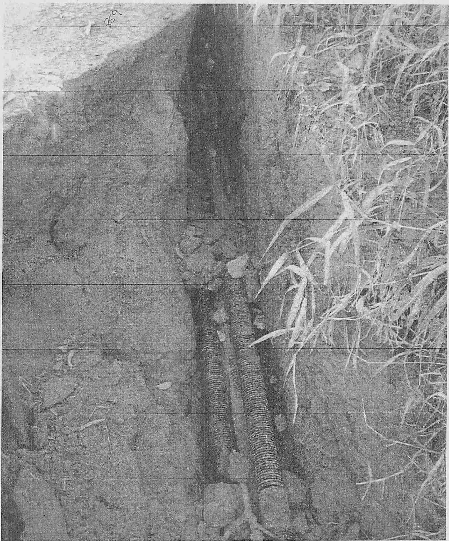
Estiada municipal do caeté - "cabos de telefonia"