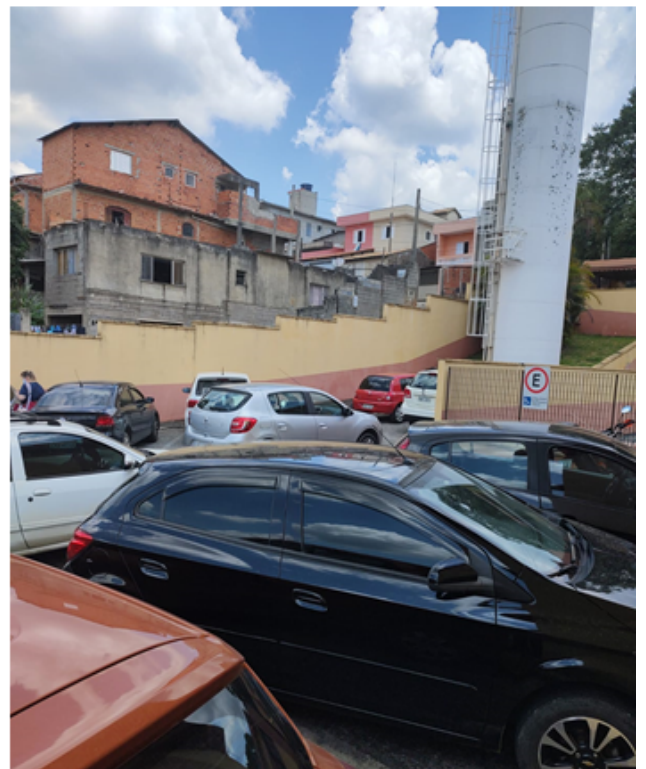
Estacionamento e via pública em frente à EMEF Profª Carmen Lucia Blanco C. de Brito. PROTOCOLO Nº CETSR 03/03/2022 - 11:13 2897/2022/lcl