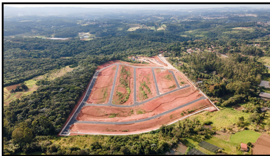
Residencial Sunflower – Cotia / SP

Rua São Paulo, 355 - Jd. Renê - CEP 18135-125 - Caixa Postal 80 - CEP 18130-970 CNPJ/MF: 50.804.079/0001-81 - Fone: (11) 4784-8444 - Fax: (11) 4784-8447 Site: www.camarasaoroque.sp.gov.br | E-mail: camarasaoroque@camarasaoroque.sp.gov.br São Roque - 'A Terra do Vinho e Bonita por Natureza'