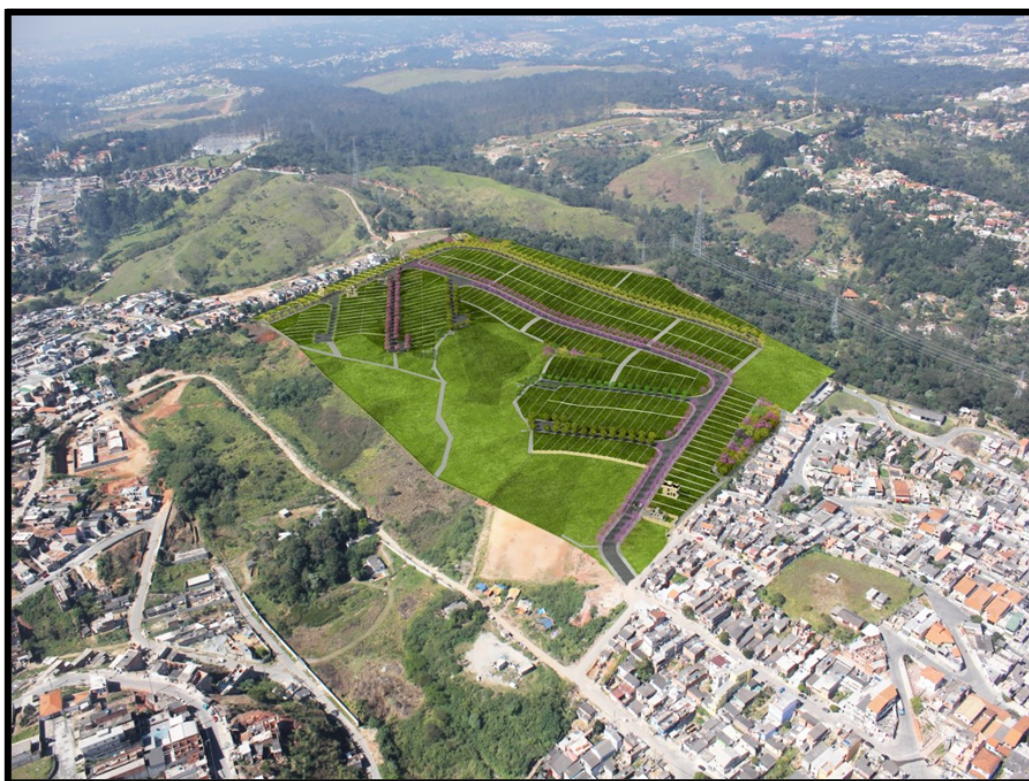
Reserva da Roselândia – Itapevi / SP