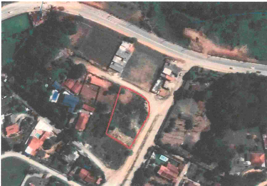
Figura 1. Imagem do local vistoriado.

O local foi vistoriado pela equipe da Divisão Municipal do Meio Ambiente na data de 02/03/2022, e foram geradas as coordenadas geográficas.