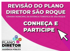
Revisão do Plano Diretor Municipal