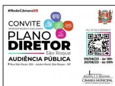
Câmara Municipal realiza segunda audiência pública para apresentação e discussão do Plano Diretor no domingo, dia 20 de agosto