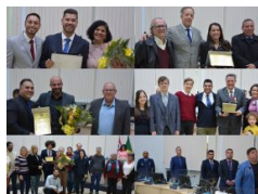
Câmara Municipal celebra 366 anos de São Roque com tradicional Sessão Solene