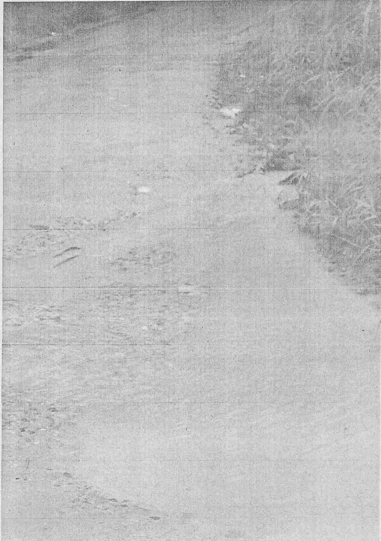
Estrada Sevinha do coumo.